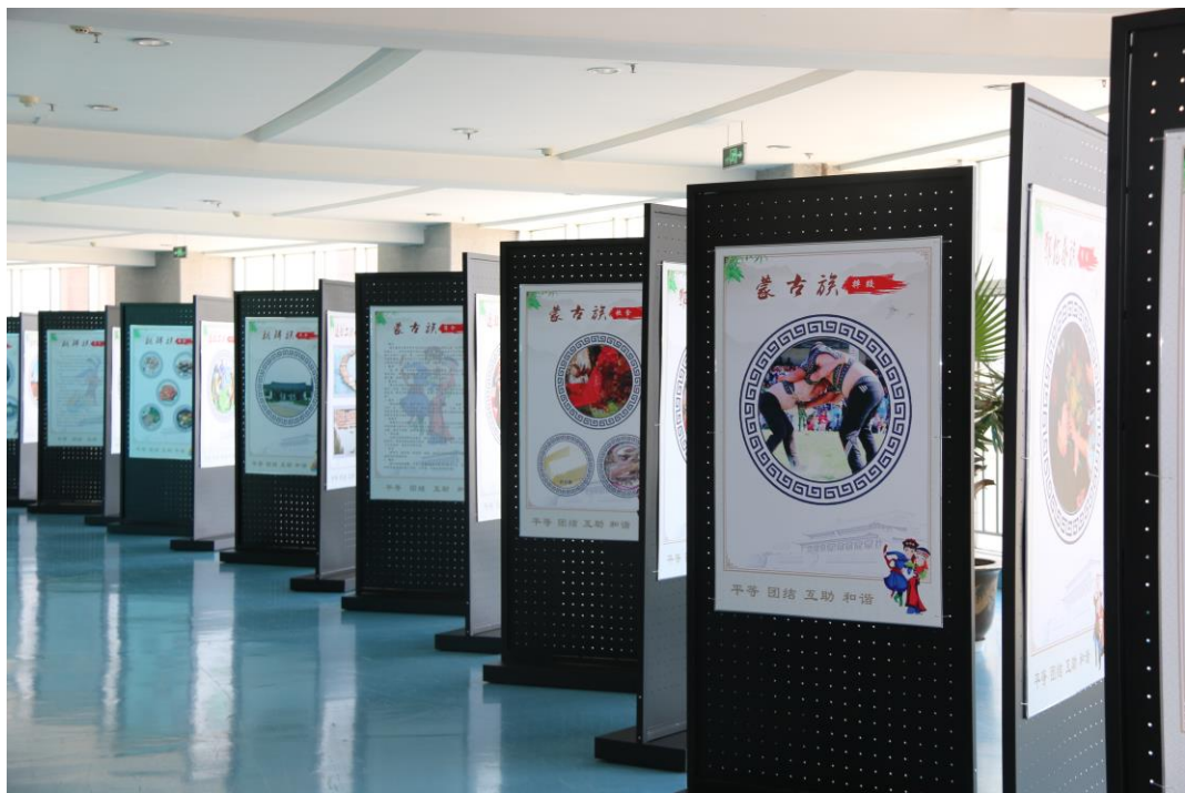
东北少数民族风俗展

2016年5月东北少数民族风俗展以独特的形式在图书馆的三楼大厅向全校师生展出，用优美的引言开始，通过直观生动的图片配上丰富明快的语言，依次对东北地区满族、朝鲜族、赫哲族、蒙古族、鄂伦春族、达斡尔族等少数民族的服侍、饮食及居住习惯等进行了全方位具体的描述，最后加以动人的结尾。通过参观东北少数民族风俗展使全校师生对脚下的这方土地以及这方土地养育的人们有了更加深刻的了解，丰富了我们的知识，这也是本次风俗展的根本目的。我们从风俗开始，一起阅读东北，了解这一方水土，了解这一方人。